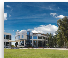
Instituto Secundaria de Cag

Project "MILAGE -Mathematics bLended Augmented GamE"